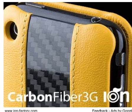
www.ion-factory.com Feedback - Arts by Google

Giancarlo Fisichella è stato ospite presso il circuito di Vallelunga all'eSafety Challenge 2009, patrocinato dalla Fia e dall'AcI a sostegno e promozione della sicurezza stradale. Con il pilota romano, per la prima volta in veste ufficiale Ferrari, diversi personaggi del mondo delle corse, come Heikki Kovalainen , Robert Kubica e Tom Kristensen , solo per citarne alcuni.