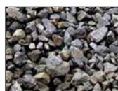
关注国际铁矿石谈判