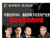
通胀预期下房地产投资