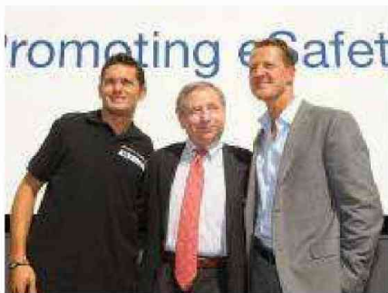
Giancarlo Fisichella, Jean Todt und Michael Schumacher unterstützen die FIA

Beim eSafety -Pojekt der FIA trafen Michael Schumacher und Giancarlo Fisichella erstmals als Ferrari-Kollegen aufeinander.