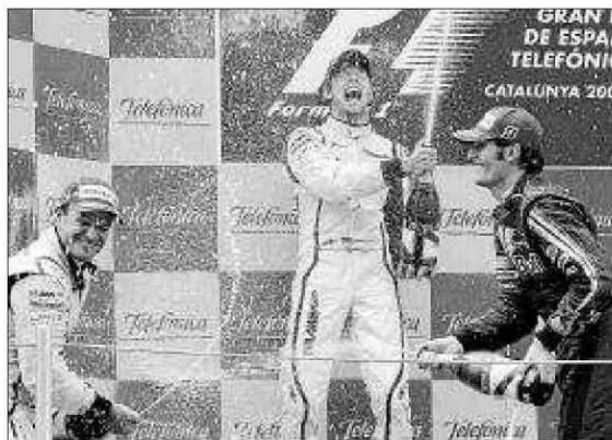
Button ganó en 2009 saliendo también desde la 'pole position'.

peonato». «Es hora de demostrar que queremos este campeonato más que cualquier otro», sentenció.